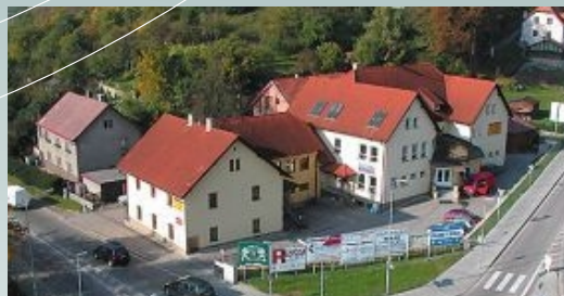
budova SPV Pod Kamenem