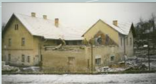
původní objekt Pod Kamenem

Vedení školy se rozhodlo prostory stávající dílny a garáže Pod Kamenem v Českém Krumlově zrekonstruovat, rozšířit a vytvořit zcela nový školní areál s dostatečnou kapacitou a dalším zázemím pro výuku stavebních oborů.